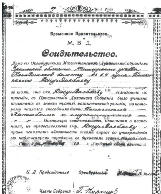
Сурет Ә.3 - ОМДМ-нің қазыы Ғ. Қараштың қолы қойылған құжаттар