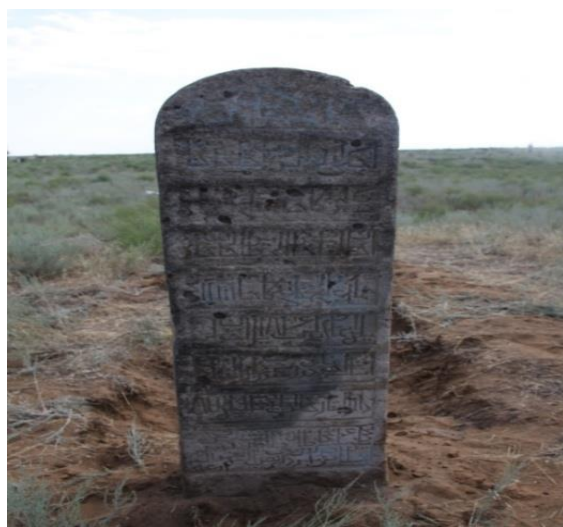
Сурет В.2 - Хан қорымындағы ахунЖабир Хамадовтың құлпытасы