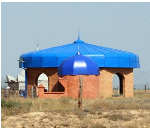
Сурет Ғ.5 - Жұмағазы хазіреттің кесенесі