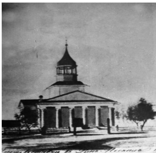
Сурет В.1 - Хан ставкасындағы мешіт