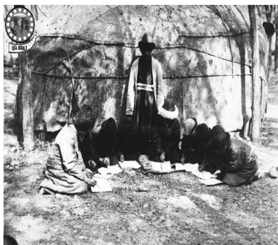
Сурет В.3 – Молданыңшәкірттері