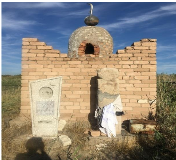
Сурет F.6 - Едіге ишанның Қаратөбедегі зираты