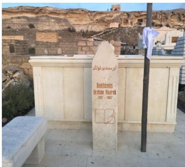
Сурет F.7 - Ермұхамед Төлегенұлының Маңғыстаудағы зираты