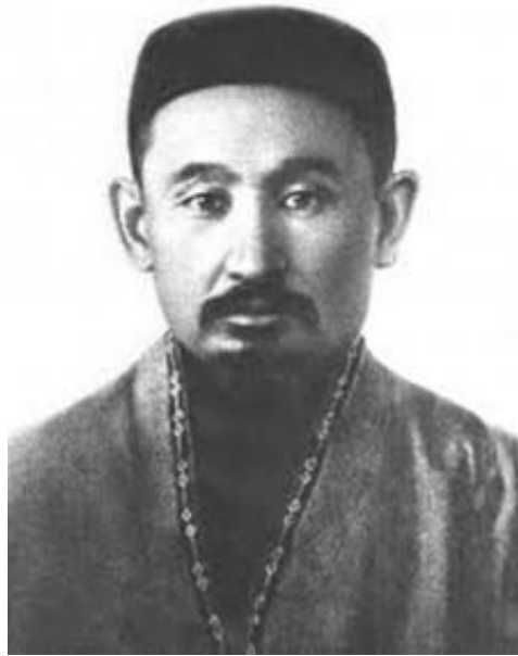
Сурет Ә.1 - Ғұмар Қараш (1874-1921)