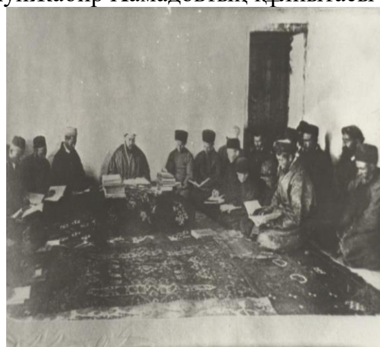
Сурет В.4 - Медреседегі қазақшәкірттерге сабақ беруі