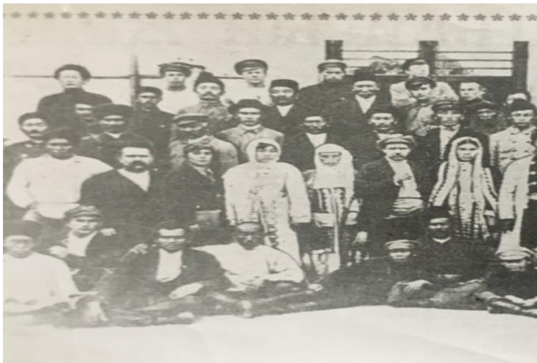
Сурет Б.3 - Ғ. Мұсағалиевтың РКФСР-дың Ағартушалық комиссиараты шақыртуымен Мәскеуге барған кезі. Алдыңғы қатарда Ғ.Мұсағалиев пен Кеңес Одағының батыры Мәншүк Мәметованың әкесі, ақын Ахмет Мәметов екеуі таяу, құшақтасып отыр.