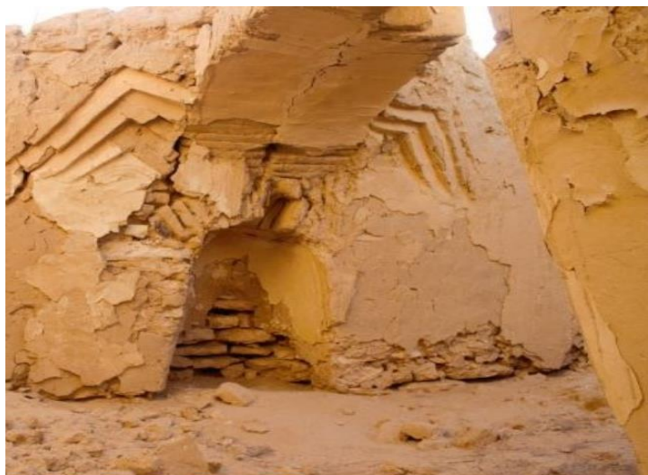
Сурет Ғ.3 - Нұржан ишанның Доңызтаудағы мешіт медресесінің сақталған михрабы