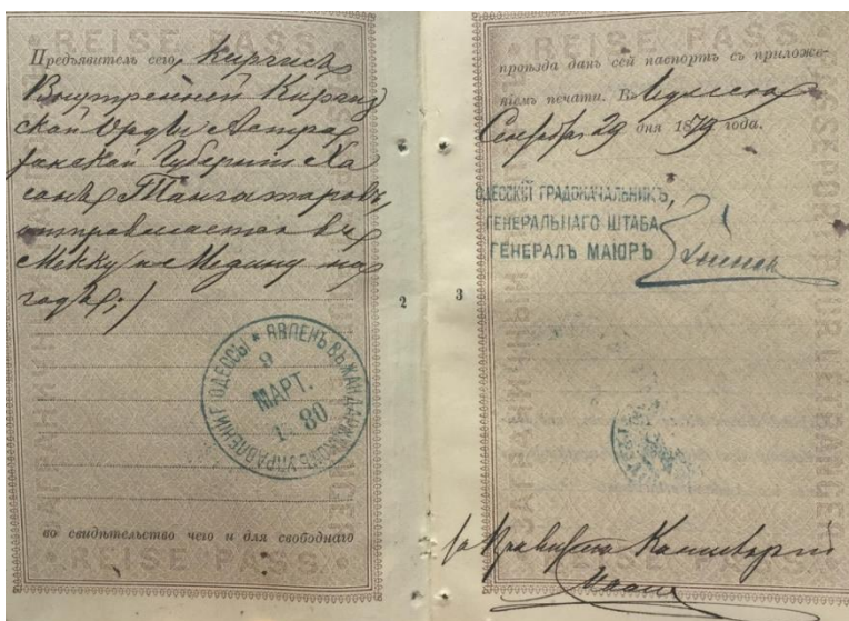
Сурет Ғ.1 - Ішкі Орда, Қалмақ округі №13 старшындығының тұрғыны Хасан Таңғатаровтың 1879 жылы қажылыққа барғандығын растайтын төлқұжаты