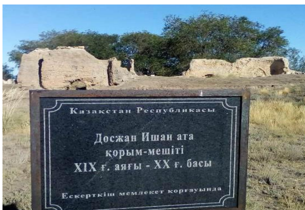
Сурет Ғ.4 - Досжан хазіреттің Шиілісудағы мешітінің қазіргі кездегі сақталған қабырғалары